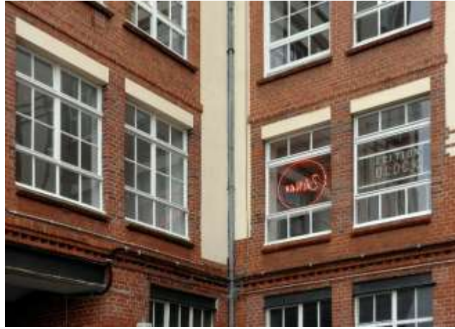
Görsel 9. TANAS ve Edition Block dış görünüm, Heidestraße 50 , Berlin-Tiergarten.

izleyicilerle etkileşime girmesine yönelik bir platform olarak Vehbi Koç Vakfı (VKV) tarafından TANAS - Çağdaş Türk Sanatı İçin Alan/Proje Alanı (TANAS - Raum/Projektraum für zeitgenössische türkische Kunst) adıyla bir “Türk Kunsthalle [Sanat Alanı/Salonu]” açılmıştır (Babias ve Block, 2014:7; TANAS, t.y.; Block, 2016; 2018). “TANAS”, Türkçe “sanat” kelimesinin tersten okunuşuyla oluşturulmuş bir anagramdır. Finansal olarak tamamen VKV tarafından desteklenen mekânın idari ve sanatsal anlamda sorumlusu René Block olmuştur. Yine aynı yıl, Block tarafından TANAS ile aynı katta, Edition Block ismiyle bir galeri (Görsel 9) açılmıştır. Yazar Günter Herzog (2009:9), uzun yıllar sonra René Block’un tekrar bir galeri açmasını, “köklerine dönmek” olarak yorumlamıştır.