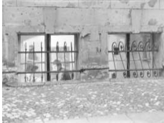
Görsel 1. Galerie René Block, Frobenstrasse 18 , Berlin-Schöneberg, 1964.