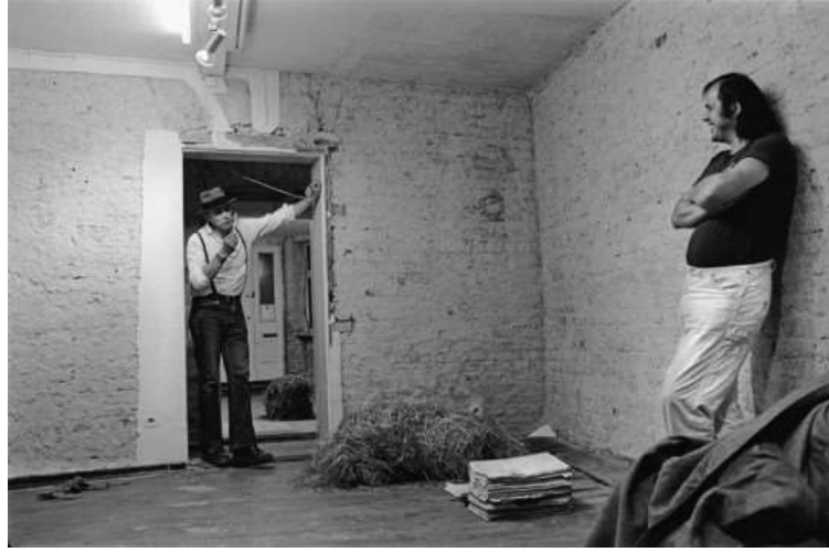
Görsel 8. Joseph Beuys ve René Block, Evet, şimdi bu boku burada bitirelim (Ja, jetzt brechen wir hier den Scheiß ab) sergisinin kurulumu sırasında, Galerie René Block, Berlin, 1979.

ihtiyacı olduğunu belirtmiştir. Dolayısıyla karar verme aşamasında Block, ya bir satıcı olarak sanatçılarla birlikte para kazanmayı tercih etmesi ya da onlarla arkadaş kalarak daha farklı bir seviyede çalışmalarını sürdürmesi gerektiğini düşünmüştür. Bu farklı, bilinmeyen seviyenin çekiciliğine kendisini kaptırarak yeni bir meydan okuma hissiyle büyük ölçekli sergiler organize etmeyi tercih etmiştir (Babias, 2001:13).