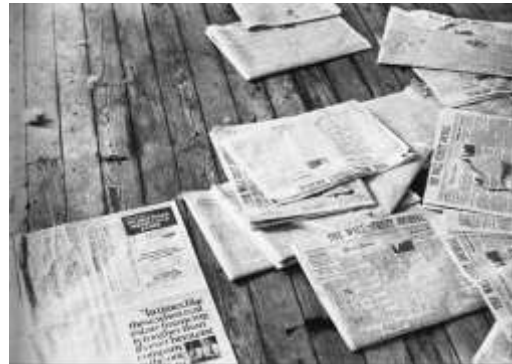
Görsel 7. Koyote/Kır Kurdu. Amerika'yı Seviyorum, Amerika da Beni Seviyor, 1974, 35 dk, siyah beyaz, konuşmasız, 16 mm film, René Block Gallery, New York.