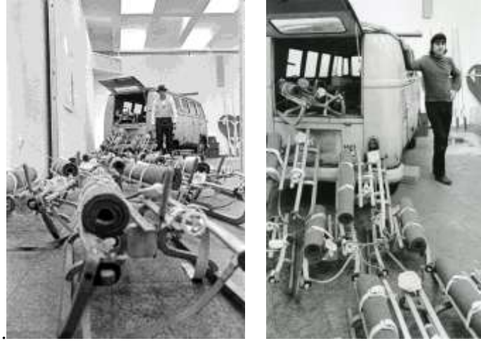
Görsel 4. 3. Kölner Kunstmarkt sol: Joseph Beuys Sürü yerleştirmesi ile birlikte 3. Kölner Kunstmarkt'ta, 1969, sağ: René Block Joseph Beuys'un Sürü yerleştirmesiyle 3. Kölner Kunstmarkt'ta, 1969.

Block, 1969 yılında gerçekleşen 3. Kölner Kunstmarkt'ta 23 Joseph Beuys'un "Sürü" (The Pack/Das Rudel) başlıklı işini 24 (Görsel 4) rekor bir fiyatla 110.000 DM'ye (Alman Markı) satar. 25