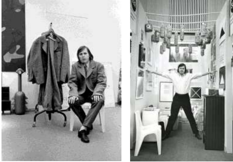
Görsel 5. 4. Kölner Kunstmarkt ve Kunstmesse Basel