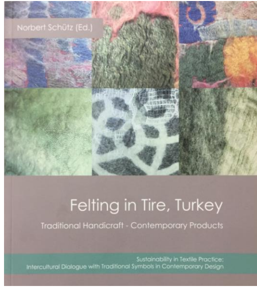
Görsel 2. Katalog.

anlamda zararları hesap etmek ve daha doğru önermelerde bulunabilmek için bilimsel verilerden yardım almak gerektiğini ifade etmiştir. Bu noktada, sürdürülebilirliğin disiplinler arası birliktelikle yürütülebileceğini vurgulamıştır. 2016 yılında sonlanan projenin sonunda bir katalog oluşturulmuş ve bu katalogta katılımcıların proje hakkındaki yorumları, deneyimleri ve bilimsel çalışmaları ile proje katılımcısı öğrenci ve akademisyenlerin ürettikleri tasarımların görselleri yer almıştır (Görsel 2).