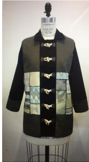
Görsel 6. Yukarı Dönüşüm prensipleri kullanılarak tasarlanan ceket.

A.B.D.'de yapılan araştırmanın bir diğer önemli basamağı organik pamuk tarım yapılan arazisine düzenlenen geziye katılım olmuştur. Bu gezi, Doç. Lynda Grose'un danışmanlığını yaptığı Sustainable Cotton Project kapsamında, organik tarım sahası olan San Joaquin'de gerçekleştirilmiştir. Burada, organik pamuğun özellikleri, ekim- söküm, işleme, harman hallaç, yıkama ve balyalama aşamalarıyla birlikte çeşitli sunumlar izlenmiştir. Sürdürülebilir moda tasarımı eğitiminde tasarım okullarının üretim sahalarına yakın olmasının öğrencilerin hammaddenin işleniş biçimleri ve üretim süreçlerini takip etmesi açısından önem taşıdığı bu gezi ile anlaşılmıştır (Görsel 7).