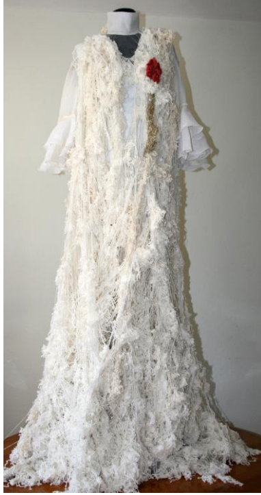
Görsel 4. Masumiyet, 2016, Artık elyaf, ikinci el gelinlik, gelin teli, L. Yıldırım.