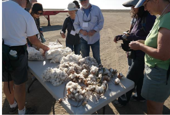
Görsel 7. Organik tarım sahası San Joaquin. Hasat edilmiş organik pamukların incelenmesi.