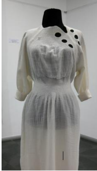
Görsel 3. Doç. Sedef Acar'ın çalışmalarından bir örnek.

sürdürülebilirlik konusuna odaklanan sonuçları arşivlemiştir. Yayınlarında tekstil mirasının somut nesnelere yanında, üretim geleneğinin eylemsel sürdürülebilirliğine de vurgu yapan Acar, bu kavramın daha geniş kitlelerce bilinmesi ve anlaşılması için moda tasarımcılarının bu alanla ilgili topluluklar kurabileceğini, tasarım ve moda haftaları içinde bu kavramın güncel tasarım dili aracılığıyla dikkat çekici şekilde öne çıkarılabileceğini bir öneri olarak sunmuştur (Acar, 2017).