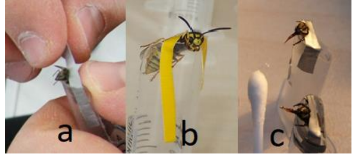
Şekil 1. Arıların denemeye alınma safhaları a) Şırıngaya yerleştirme b) Bağlama c)Tepkilerinin ölçülmesi

Çalışmada kullanılan bal arılarının belirlenmesi için 50 kovan Anadolu arısı, 50 kovan Kafkas arısının bulunduğu arılıkların 10 metre önüne 2M'lık şekerli su bulunan bir kap, yaban arıları için ise açık alana pet şişe içerisine et konulmuştur. Bu kaba ve şişeye gelen tarlacı arılar ve yaban arıları rastgele bir şekilde küçük plastik kutular aracılığıyla yakalanmış ve laboratuvara getirilerek 5'erli gruplar halinde küçük kutulara ayrılmıştır. Yakalanan bu arılar hareketsiz kalana kadar, yaklaşık 3-4 dakika buzdolabının dondurucusunda bekletilmiştir (Hranitz vd., 2010). Hareketsiz kalan arılar kutulardan çıkarılarak baş ve toraks arasından daha önce hazırlanan şırınga haznelere bağlanmıştır (Şekil 1. a,b). Arılar ayıldıktan sonra antenlerine su ve şurup verilerek tepki verip vermedikleri belirlenmiştir (Şekil 1.c) (Abramson et al. 2004, Smith ve Raine, 2014).