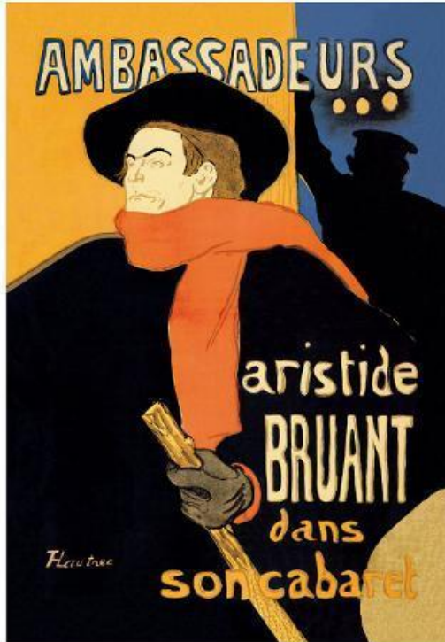
Resim 1: Artiste Bruant

Artist Bruant' ın bir şarkısı için hazırladığı afiş ilk afişi sayılmaktadır. Afişte ağırlıklı olarak beş tane renk kullanılmıştır. Şarkıcının figürü ön planda tutularak dikkatleri figürün atkısına yoğunlaştırmak amacıyla kırmızı renk seçilmiştir. Ana başlıkların büyüklüğü figüre yoğunlaşan ilgiyi etkilemeyip son derece sade ve afişin genel renkleriyle uyumlu olarak figürün arkasındaki turuncu renk aynı zamanda alt başlıkta da kullanılarak alt başlığın küçük harfli olması afişteki yoğunluğu azaltmış ve yazı uyumu sağlanmıştır. Sol üst arka zeminde yer alan insan figürü düz siyah renkte olup öndeki ana figürün önüne geçmemiştir (Resim 1).