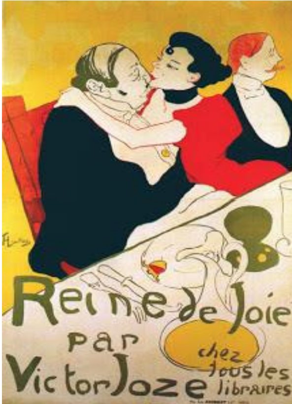
Resim 4, Reine de Joie

Rene de Joie adlı afişte bakımlı bir kadın, yemek masasında çirkin fakat varlıklı bir adamı burnundan öpmektedir. Diğer afişlerinde olduğu gibi mekanın yerleştirilmesi, belirgin kontür çizgilerinin ve renk seçimi açısından Japon resim tarzına yakındır. (Arnold, 34) Afişte iki figür detaylı olarak aktarılmış. Kullanılan yoğun sarı, kırmızı, siyah ve beyazdan oluşan dört temel renk bulunmaktadır. Kadının giydiği elbisenin kırmızı rengi afişteki dikkati üzerine çekmektedir. Zemin renginde kullanılan sarı ve içeceğin sarı rengi birbirine uyum sağlayarak sarı rengin yoğunluğunu azaltmaktadır. Masanın çizilmesi, mekanın tanıtımını yansıtan yazı ile bütünleşerek afiş tamamlanmıştır (Resim 4).