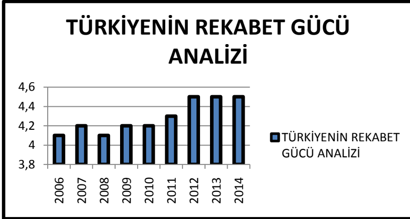
Grafik 1: Türkiye’nin rekabet gücü analizi, 2006-2014.

Kaynak: WEF, Küresel Rekabetçilik Raporu (2006, 2007, 2008, 2009, 2010, 2011, 2012, 2014)