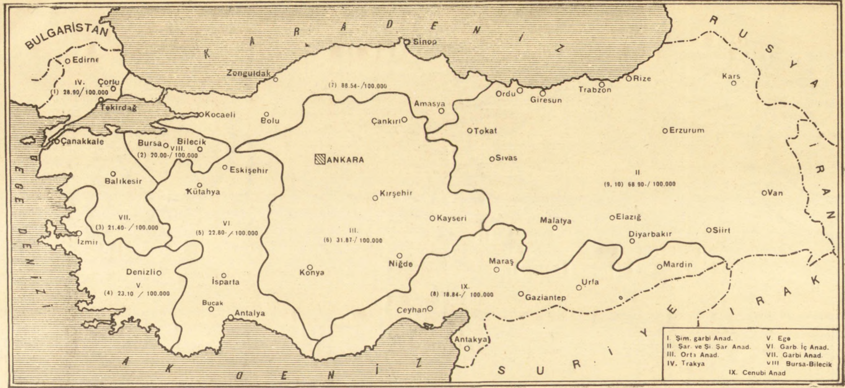
HARTA (MAP) : I

Romen rakkamları mütefekkir nisbetine göre Bölgeleri, Kerre içindeki rakkamlarda aynı çevre içinde Atropometrik ankete göre Antropolojik Bölgeleri göstermektedir.