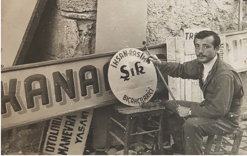
Görsel 14. Necdet Şapolyo Koza Han girişindeki dükkânda 1952 yılının Haziran ayında izinli olduğu günlerde tabela yazarken (Şapolyo, 1952).

Balıca, yalnız yazı çalışmaları yapmakla kalmaz, aynı zamanda resimleme çalışmalarında da babasının yanında edindiği beceriyi gösterme fırsatı bulur. Görsel 13'te 1969 yılında beşincisi düzenlenen Bursa Millî Fuarı için duvar üzerine uyguladığı kılıç kalkan figürü ve dekorun önünde görülmektedir. Bursa'da uzun süre kalmayan Balıca, ailesiyle birlikte Adapazarı'na döner ve burada Mesut Reklam adında bir atölye açarak işlerine devam eder (Ertürk, 2021, ss. 174-175). Çoğu tabela ressamında olduğu gibi Balıca da yalnızca yazı değil, resim yeteneğiyle de kendini göstermektedir.