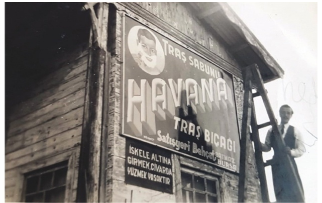
Görsel 8. Necdet Şapolyo hazırlanan tabelayı monte ederken (Şapolyo, 1950).