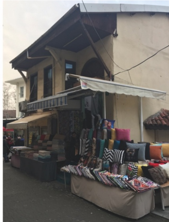
Görsel 10. 1979 yılında taşındıkları 2. İmaret Sokak'taki günümüzde Kızılay Kan Bağışi Merkezi'nin hemen yanında, kumaş pazarı olarak kullanılan bina (Ertürk, 2022).