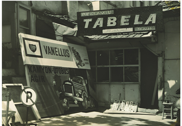
Görsel 17. Rahmi Tartan'ın Reklam-İş Tabela adlı dükkânı (Tartan, 1961).