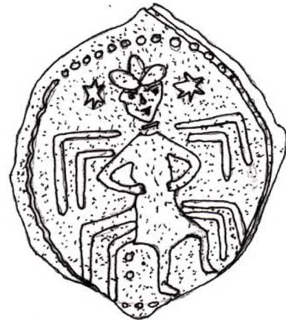
Şekil - 2