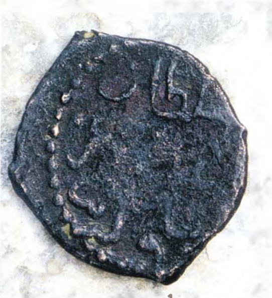
Resim : 1

Mevcut veriler ışığında, incelediğimiz sikkenin Anadolu Selçuklu Sultanı Süleyman Şah'ın altı yaşında tahta çıkan ve 1204-5 tarihinde sekiz ay gibi kısa bir süre hüküm süren, oğlu III. Kılıç Arslan'a ait olduğu kanıtlanan ilk sikke olduğunu söyleyebiliriz. Nitekim sikkenin ön yüzünde, tahtta oturan figürün, oldukça genç bir sultanı tasvir ediyor olması, bu düşüncemizi destekler. Bu figür gerek Anadolu Selçuklu Dönemi sikkeleri içerisinde, gerek diğer el sanatları örnekleri içerisinde, stil açısından benzerinin bulunmayışı ile, Anadolu Selçuklu figür repertuarına yeni bir boyut katar.