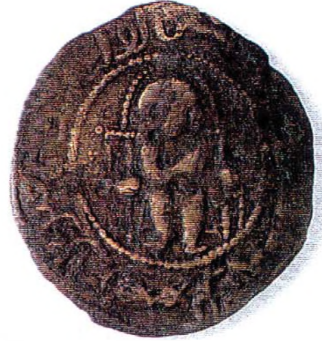
Resim : 4