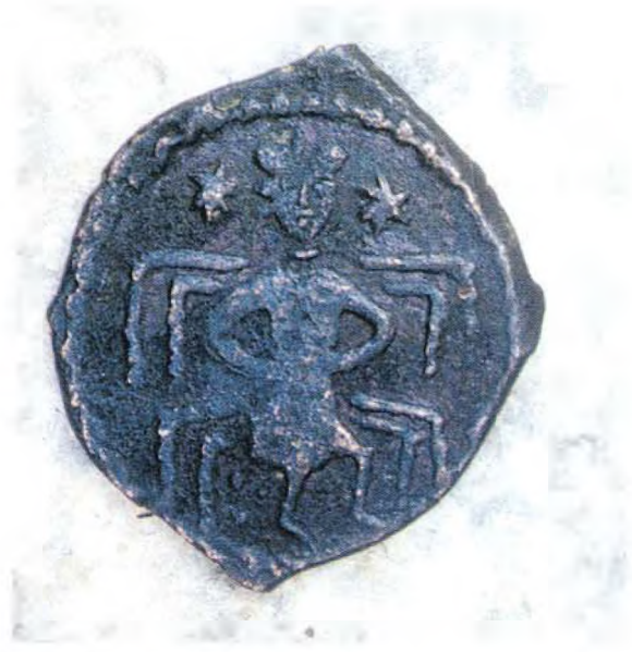
Resim : 2