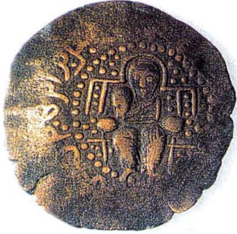
Resim : 5