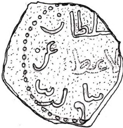
Şekil - 1