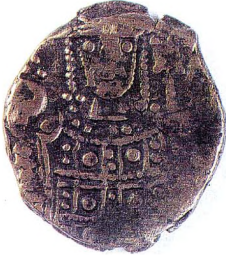
Resim : 3

Yaran), Ankara 1988, s. 343'te Selçuklu kronolojisinde "Rükneddin" veya "İzzeddin" olarak belirtilmektedir. Sikkelerinde "Es Sultanü'l Muazzam Mes'ud bin Kılıç Arslan" ibaresi yer almaktadır. "Sultanü'l Muazzam" unvanından da anlaşılacağı üzere mevcut sikkelerin bu sultana ait olma ihtimali zordur. Sikkeleri için bkz. Halit Erkiletlioğlu-Oğuz Güler, a.g.e., s.46; Lane-Poole Stanley, Catalogue of Oriental Coins in the British Museum, III, London, 1877, s. 48, no: 97; Coşkun Alptekin, "Türkiye Selçuklu Sikkelerinin İlk Örnekleri ve Bunlar Hakkındaki Bazı Mülahazalar", IV. Milli Selçuklu Kültür ve Medeniyeti Semineri Bildirileri, (25-26 Nisan 1994), Konya, 1995, s. 127-134. Konya Alaeddin Camii minber kapısında yer alan kitabesinde "İzzü'd dünya ve'ddin" unvanını kullanırken, Aksaray Ulu Camii minber kapısında bu unvana yer vermemiştir. Bkz. Zeki Oral, "Anadolu'da San'at Değeri Olan Ahşap Minberler, Kitabeleri ve Tarihçeleri", Vakıflar Dergisi V, Ankara, 1962, s. 23-79.