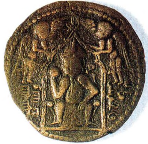
Resim : 6