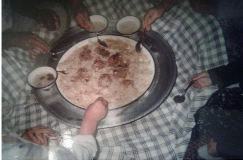
Nogayların milli yemeklerinden inkal ve sorpa

Düğün ve cenaze ile ilgili geleneklerin arkasından Nogay yeme içme kültürüne değinilmiş; kazan börek, inkal, kalakay, Nogay çayı gibi Nogay mutfağının belli başlı yemeklerine dair bilgiler aktarılmıştır.