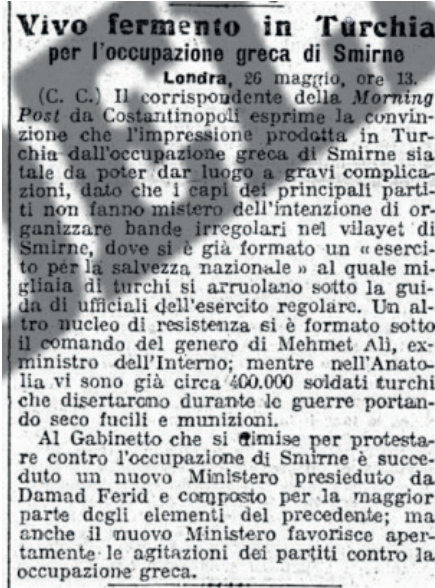
Resim 2: Corriere della Sera 'nın “Yunanlar İzmir’i İşgal Ettiği İçin Türkiye’de Büyük Bir Heyecan Yaşanıyor” Başlıklı Haberi (27 Mayıs 1919)