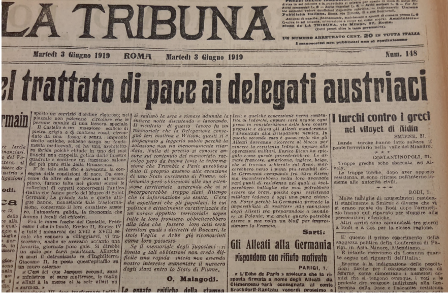
Resim 3: La Tribuna ’nın “Aydın Vilayetinde Türkler Yunanlara Karşı” Başlıklı Haberi (3 Haziran 1919)

İncelediğimiz İtalyan gazeteleri içerisinde Kuvayimilliyeler’den, “Türk çeteleri” şeklinde ilk olarak söz eden gazete 3 Haziran 1919 tarihli La Tribuna ’dır. Gazete, “Türkler, Aydın Vilayetinde Yunanlara Karşı” haberinde, Kuvayimilliyeler’den “Türk çeteleri” ( bande turche ) olarak söz etmiş ve Aydın’da demiryolu köprüsüne saldırdıkları bilgisini vermiştir 15 .