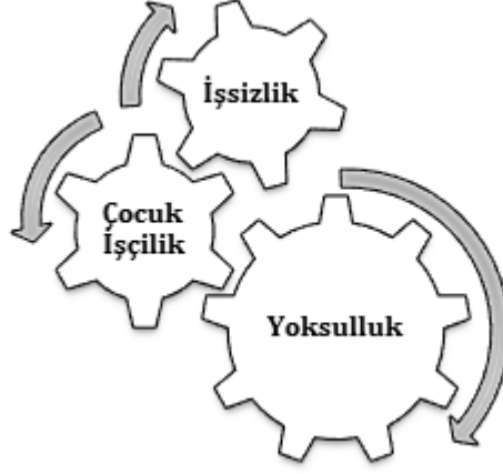
Şekil 2: Yoksulluk-Çocuk İşçilik Döngüsü