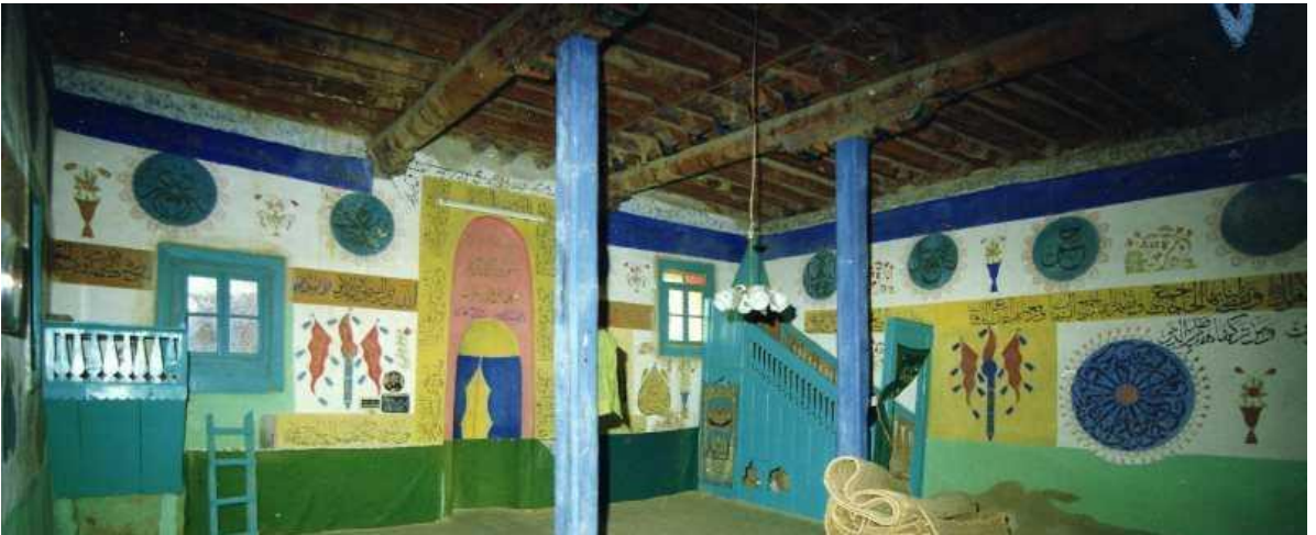
Fotoğraf 18: Çivril Bayat Camii ( https://www.kulturportali.gov.tr/turkiye/denizli/kulturenvanteri/bayat-camisi )