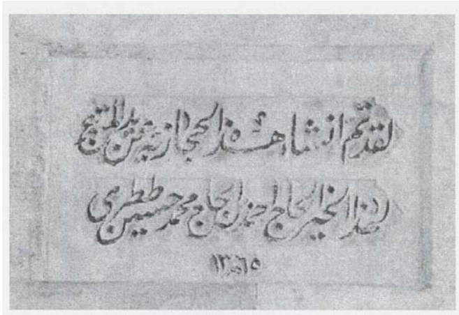
Resim 5: Hicaziyenin Kitabesi