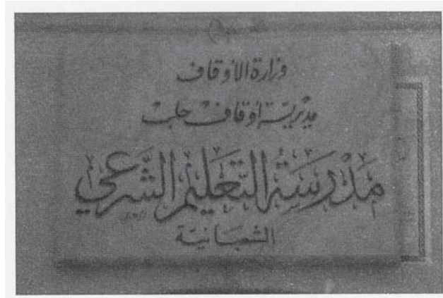
Resim 2: Medresenin Kitabesi