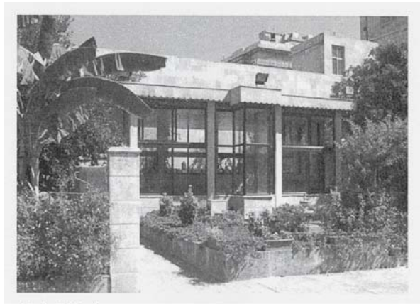
Resim 3: Şadırvan