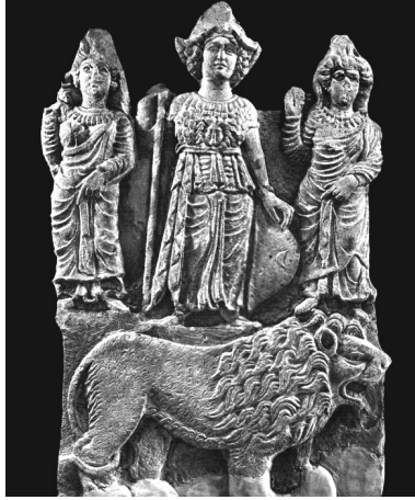
Uzzâ, Lât ve Menât figürleri [107]

Menât'ın dikildiği yer ile ilgili kaynaklarda çok sayıda rivayet olmasına rağmen ona tahsis edilen mabed hakkındaki bilgiler oldukça kısıtlıdır. Bununla birlikte Taberî, sunağın Müşellel [105] ya da Kudeyd'te olabileceğini söylemektedir. [106] Rivayetlerde bu iki yer ön plana çıktığı için mabedin de buraya yapılmış olması kuvvetle muhtemeldir.