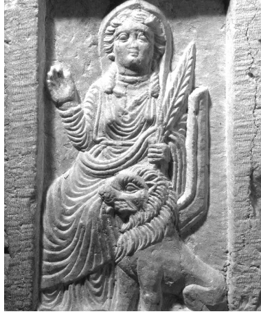
Lât figürü [72]

6) “Lât”, bir kayadır ve ilk başlarda bu kayanın üzerinde oturup hacılara yağ ve süt satan kimseye [70] “Lât” ismi verilmişti. [71]