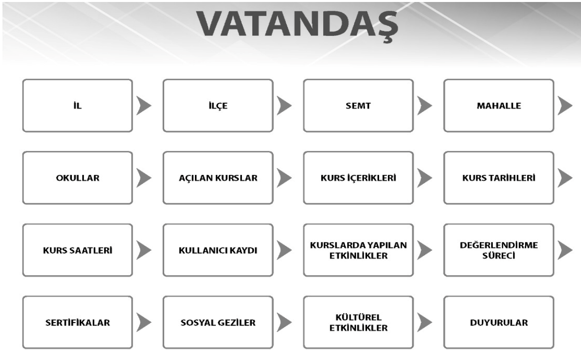
Şekil 1. Vatandaş için web sitesi veya mobil uygulama bilgi ekranı

Şekil 1’de Mobil uygulama ve/veya web sitesini oluşturulduğunda vatandaşlar, sisteme giriş yapabilir. Kendi yaşam boyu öğrenme faaliyetlerine ilişkin süreç takibini gerçekleştirerek Şekil 1’de gösterilen modüllere ilişkin süreçleri aktif olarak yönetebileceklerdir.