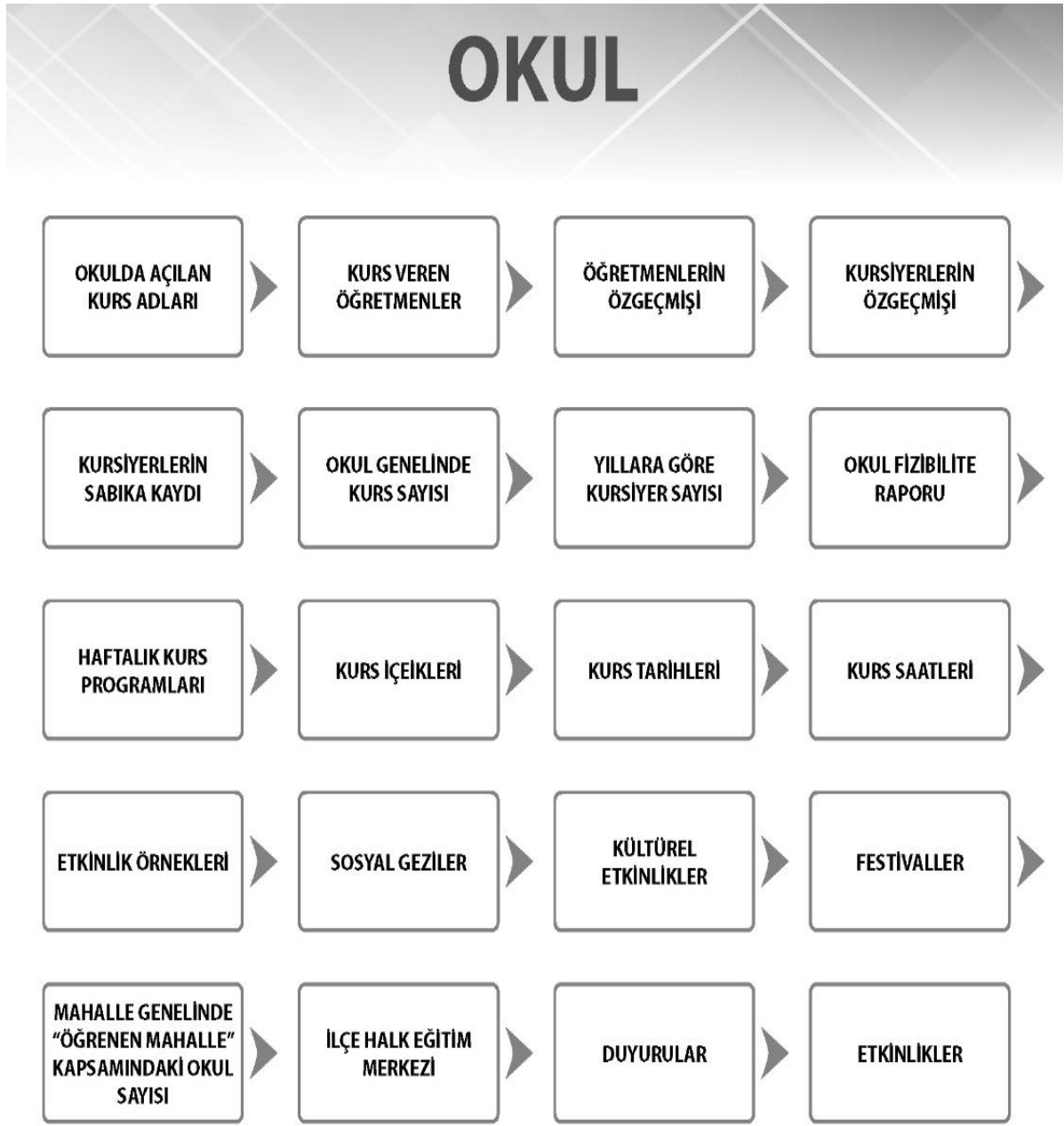
Şekil 3. Okul yöneticisi için web sitesi veya mobil uygulama bilgi ekranı

Okul yöneticileri, Mobil uygulama ve/veya web sitesini oluşturulduğunda Şekil 3'te gösterilen modüllere ilişkin süreçleri aktif olarak yönetebileceklerdir.