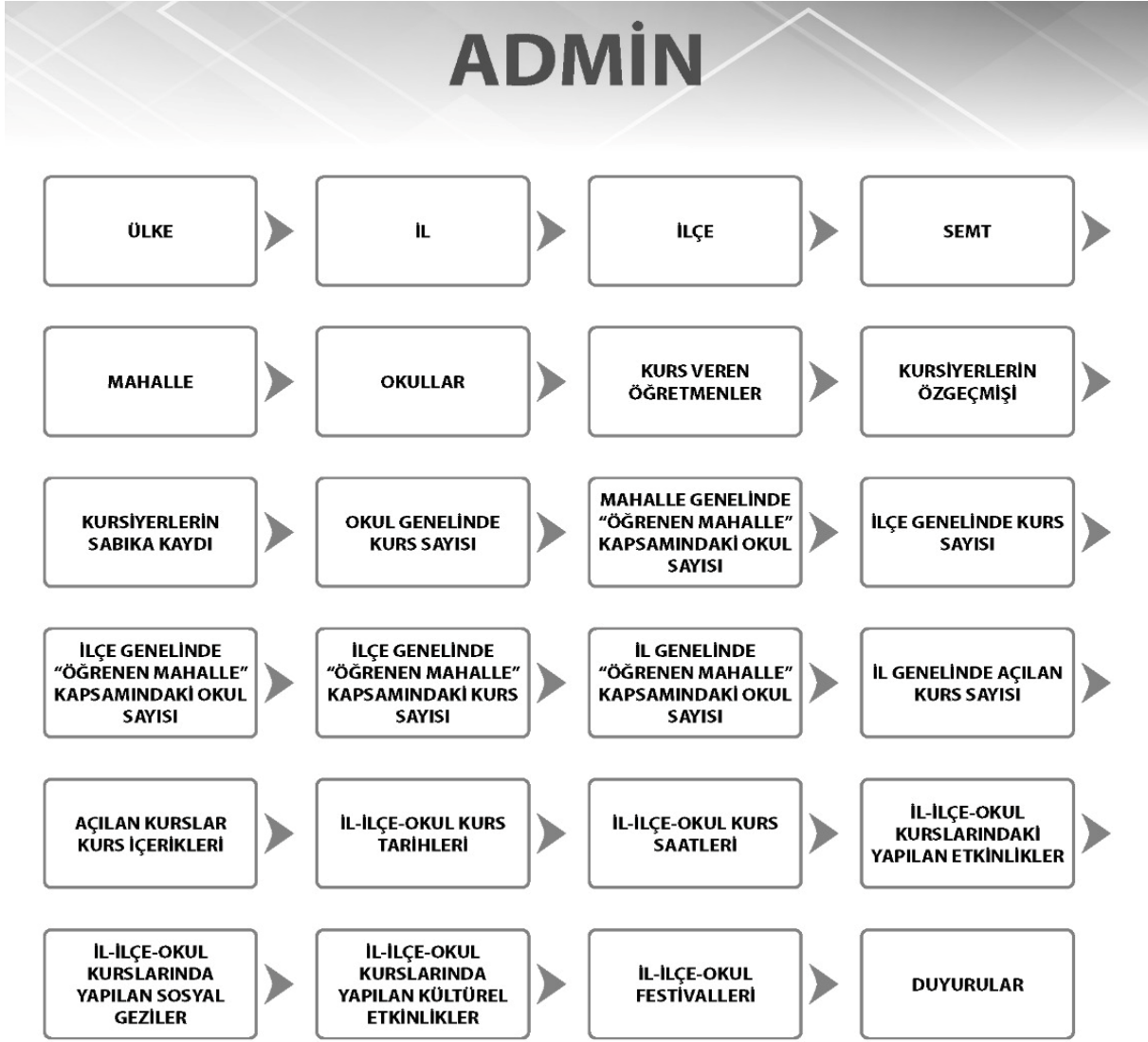
Şekil 2. Admin için web sitesi veya mobil aplikasyon bilgi ekranı

Admin, Mobil Uygulama ve/veya web sitesi üzerinden sisteme giriş yapabilir. Mobil uygulama ve/veya web sitesini oluşturulduğunda admin'ler Şekil 2'de gösterilen modüllere ilişkin süreçleri aktif olarak yönetebileceklerdir.